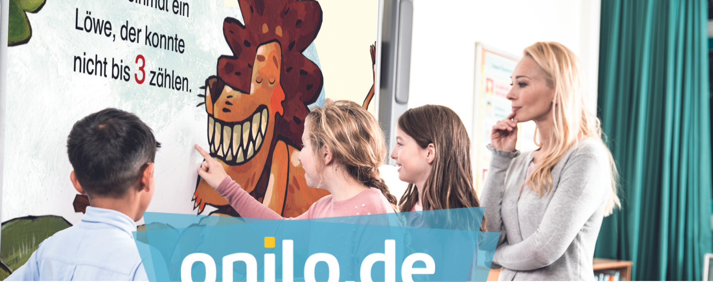
Illustration: © Martin Baltzschelt, © Beitz & Gelber